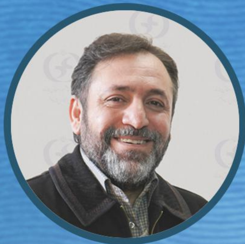
دکتر مهدی زارع بهرام آبادی معاون امور استان‌ها