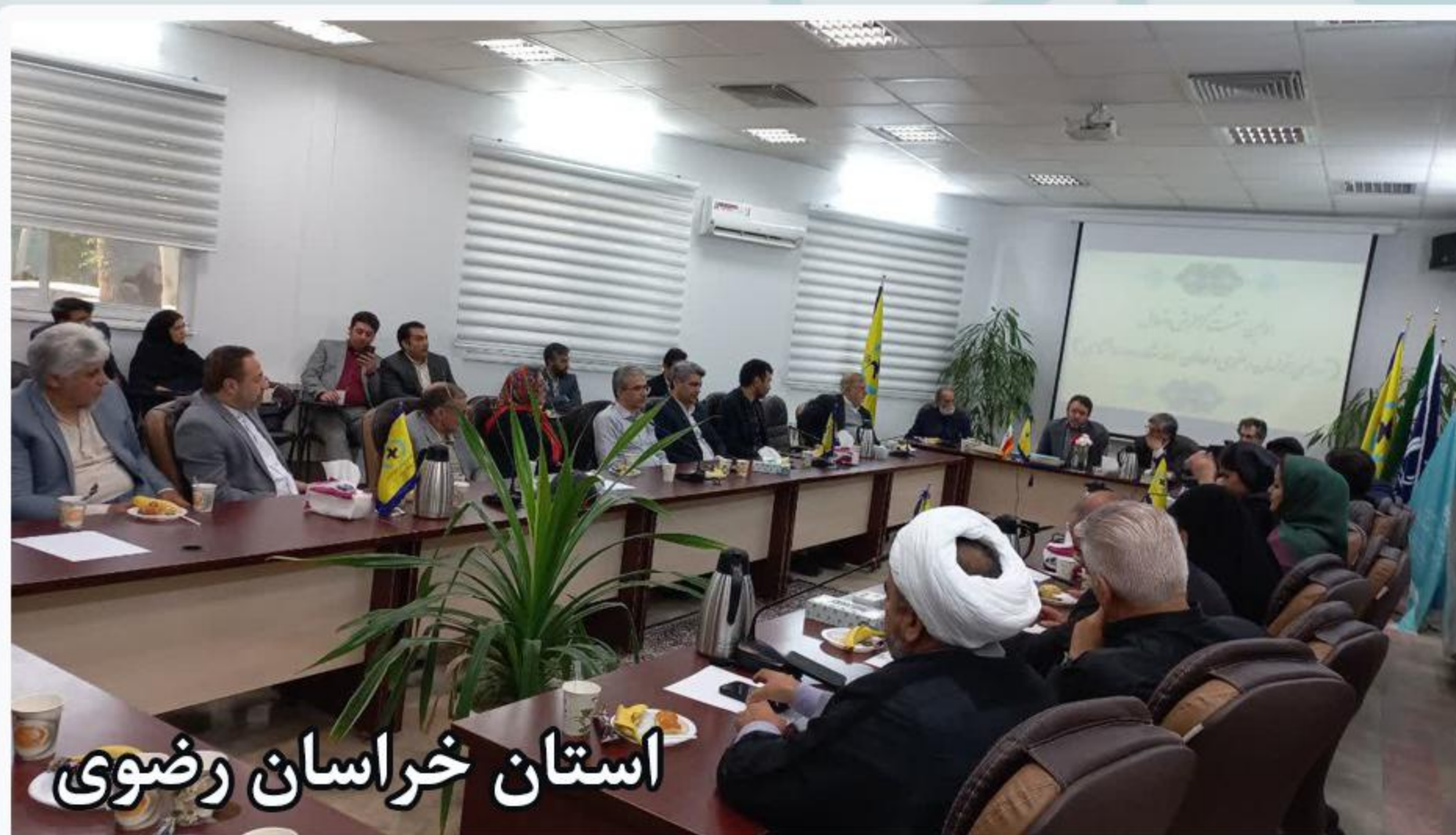
استان خراسان رضوی